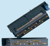
Druckkopf für die HP Edgeline Technology